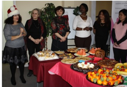
L'équipe de CEJFI souhaite une heureuse année 2014 aux bénévoles

Chaque année, le nombre significatif des bénévoles aident le CEJFI à faire certaines activités. Une des activités principale est le dépannage alimentaire, qui a lieu chaque vendredi. L'équipe du CEJFI est reconnaissante envers toutes les personnes qui font des sacrifices pour le bien-être des bénéficiaires de nos services. C'est pour cela que nous avons organisé le party de