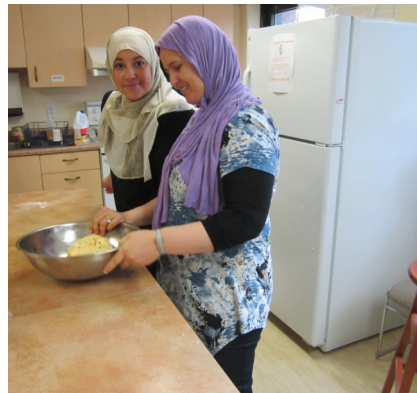
Les femmes font la pâte à gâteau.

L'atelier de cuisine communautaire se poursuit. Il est destiné aux femmes qui veulent partager les recettes qui viennent d'ici et d'ailleurs. Également, c'est une activité d'échanges culturelles et de la promotion des habitudes alimentaires saines. Les participantes font découvrir des produits spécifiques de leur pays d'origine et donnent des conseils sur la cuisson de ces produits.