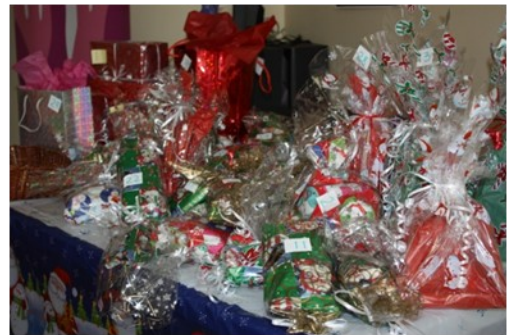
La table des cadeaux

Noël pour nos bénévoles. L'événement a débuté par les mots de reconnaissance de la part des employées du CEJFI. Par la suite, le buffet international et les danses ont été au rendez-vous. La fin de party de Noël a été marquée par le tirage des cadeaux. Nos invités étaient contents. C'était un vrai succès et une bonne façon pour nous de terminer l'année 2013 en beauté.