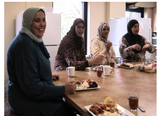
Après avoir cuisiné, les participantes mangent ensemble.