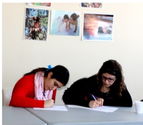
La mentore travaille avec sa mentorée pour élaborer un plan d'action efficace

pagné les jeunes filles dans leur cheminement scolaire. Les filles ont été prêtes à relever des défis de mentorat, découvrir les professions en sciences et en techniques, faire des réflexions sur leur futur professionnel et apprendre des nouvelles choses sur les métiers traditionnellement masculins. Lors de la première rencontre qui a eu lieu le 19 décembre 2013, chaque mentore a parlé de son parcours scolaire et professionnel. Après cette petite présentation, nous avons formé les paires mentore-mentorée. Les mentores ont discuté avec les filles de leurs objectifs afin d'établir un plan d'action à suivre. Ainsi, les jeunes filles ont eu un accompagnement, un support et un coup de main de professionnelles. Les mentores sont aussi un bon exemple de réussite et de performance scolaire pour les filles. Les paires mentore-mentorée sont appelées à garder le contact tout au long de l'année scolaire. Toute l'équipe de CEJFI souhaite aux jeunes filles une bonne chance et de belles réussites scolaires.